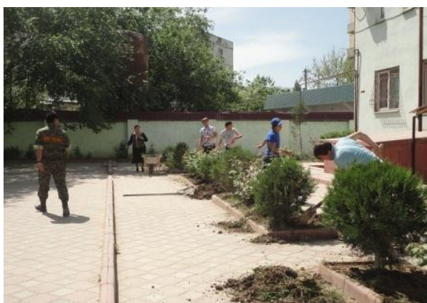
Очередной традиционный субботник в Социально-педагогическом институте

г. Дербент, ул. Тахо-Годи, 2 (район ж/д вокзала, около моста) тел. 8 928 582 76 06